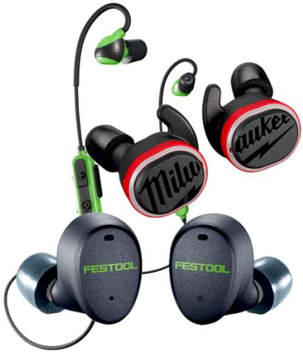
Nappimalliset aktiivisuojaimet bluetoothilla