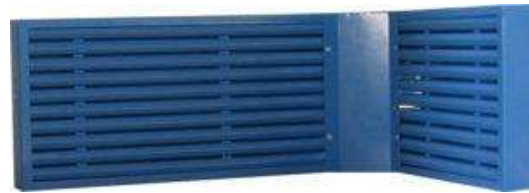
Imupaneelit / vetokaapit / kohdepoistot