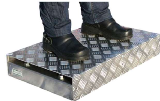
Koroke "Palle" Myös sähköpöydät