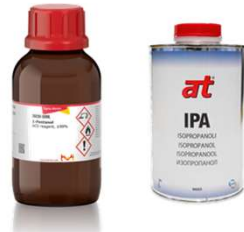
Kemikaalien korvaaminen 1-Pentanol → Isopropanoli